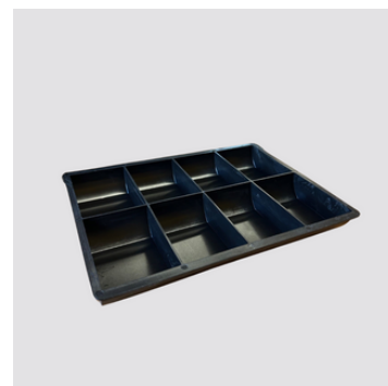
Portamonete in polipropilene nero a vari scomparti. (Inclusi in tutti i modelli)