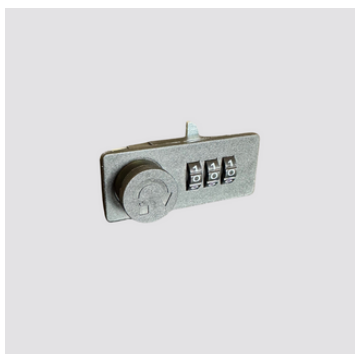
Serratura a combinazione, 3 cifre