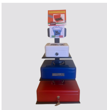
Espositore su richiesta