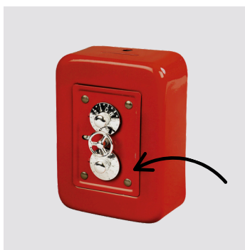
Serratura vintage a 2 rotelline