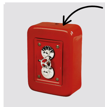
Feritoia per introdurre le monete