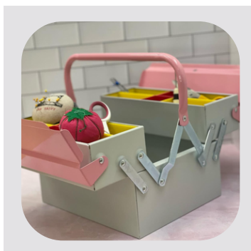
Ideale per un'applicazione professionale e domestica

Non utilizziamo alcun materiale dannoso alla salute. Le procedure di lavorazione sono contenute nel manuale della qualità rev.2 del 30/4/01 e nelle singole procedure. Tutte le fasi di lavorazione sono effettuate in Italia.