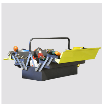
Alta capacità di contenimento per utensili di ogni tipo.