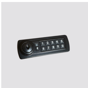
Serratura elettronica a combinazione, con chiave d'emergenza

Non utilizziamo alcun materiale dannoso alla salute. Le procedure di lavorazione sono contenute nel manuale della qualità rev.2 del 30/4/01 e nelle singole procedure. Tutte le fasi di lavorazione sono effettuate in Italia.