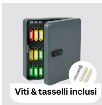
Viti & tasselli inclusi

Numerini adesivi inclusi. Viti e tasselli di fissaggio inclusi.