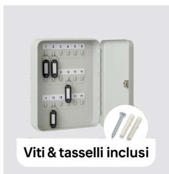
Viti & tasselli inclusi

Numerini adesivi inclusi. Viti e tasselli di fissaggio inclusi.