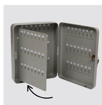
Bandiera portachiaavi, nei modelli 4A - 5B

Numerini adesivi inclusi. Viti e tasselli di fissaggio inclusi.