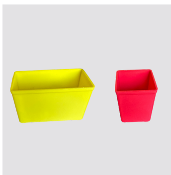
Vaschette in plastica portaoggetti, incluse