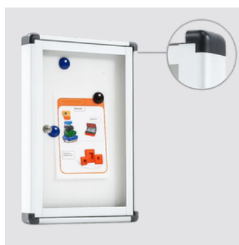
Dotata di 4 angolari in pp