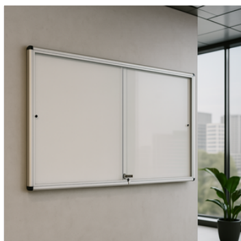
Elegante e adatta ad ogni ambiente