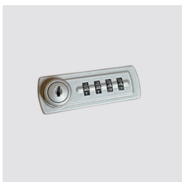
Serratura a combinazioni con chiave d'emergenza

Non utilizziamo alcun materiale dannoso alla salute. Le procedure di lavorazione sono contenute nel manuale della qualità rev.2 del 30/4/01 e nelle singole procedure. Tutte le fasi di lavorazione sono effettuate in Italia.