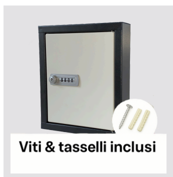
Numerini adesivi inclusi. Viti e tasselli di fissaggio inclusi.