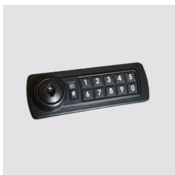
Serratura elettronica con chiave d'emergenza

Non utilizziamo alcun materiale dannoso alla salute. Le procedure di lavorazione sono contenute nel manuale della qualità rev.2 del 30/4/01 e nelle singole procedure. Tutte le fasi di lavorazione sono effettuate in Italia.