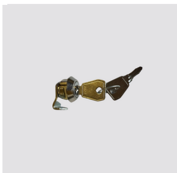
Serratura a chiave, fornito con 2 chiavi duplicabili

Non utilizziamo alcun materiale dannoso alla salute. Le procedure di lavorazione sono contenute nel manuale della qualità rev.2 del 30/4/01 e nelle singole procedure. Tutte le fasi di lavorazione sono effettuate in Italia.