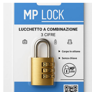
Fornito in blister