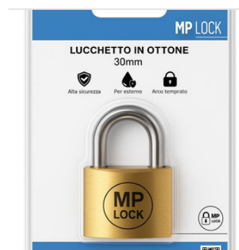
Fornito in blister