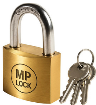
3 Chiavi duplicabili