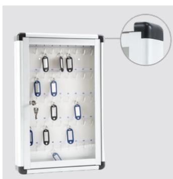
Dotata di 4 angolari in pp